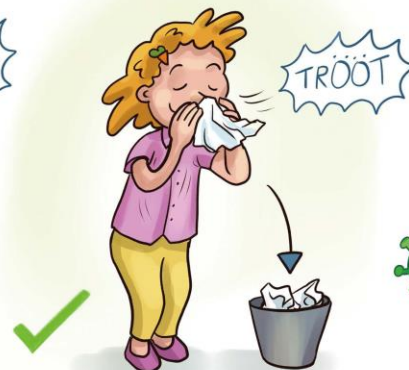
ins Papiertaschentuch schnäuzen und es entsorgen