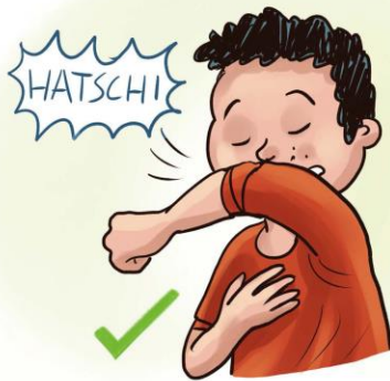
in Armbeuge husten/niesen