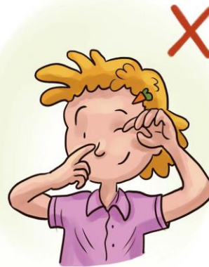
nicht ins Gesicht greifen